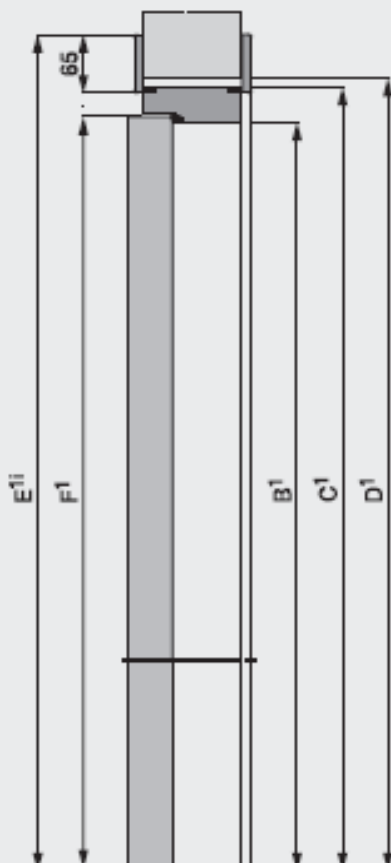
sezione verticale vertical section вертикальный разрез